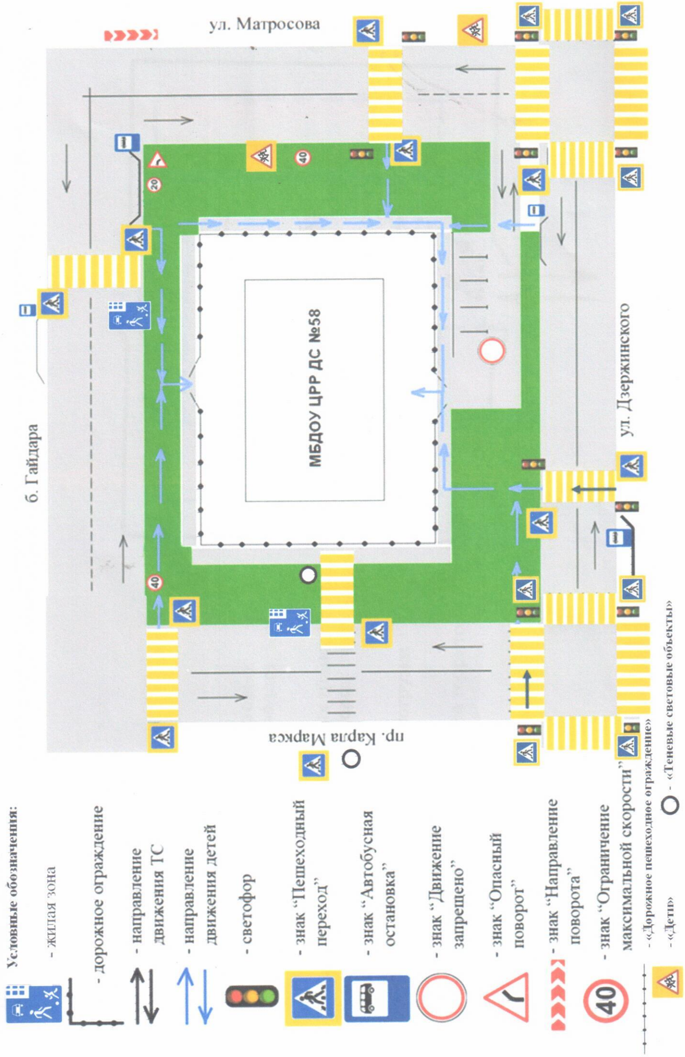
Схема организации дорожного движения в непосредственной близости от образовательного учреждения с размещением соответствующих технических средств, расположение парковочных мест